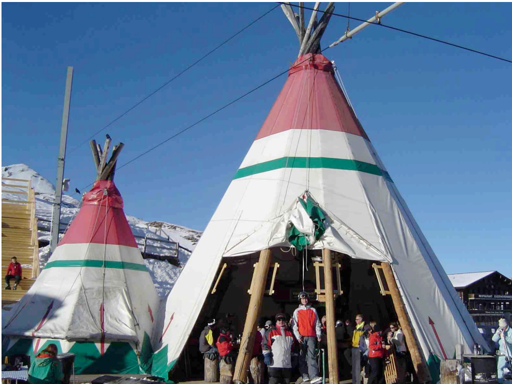
Tipi - für die Stärkung am Mittag - Suppe, Hamburger, Pizza, „Ghackets mit Hörnli...“

Um die Mittagszeit traf man sich im Tipi auf der Kleinen Scheidegg, wo eine kleine, warme Zwischenmahlzeit wartete (sehr zur Entlastung der Köchinnen, die so für kurze Zeit auch dem Wintersport huldigen konnten). Frisch gestärkt ging es danach wieder auf die Piste, und um vier Uhr war man in der Unterkunft zurück.